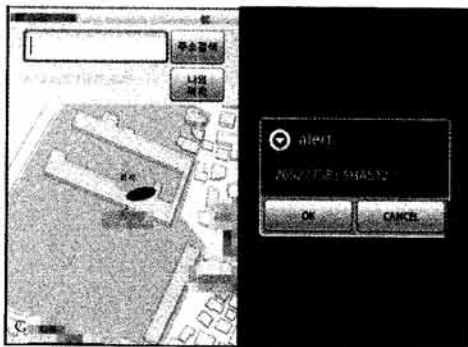
(A) 자신의 위치정보, (B) LOTP생성 (그림 3) (A)자신의 위치정보, (B) LOTP생성

실험 시나리오는 사용자가 먼저 자신이 위치한 장소의 GPS정보를 인증서버에 저장하고 조건을 만족하는 위치에서